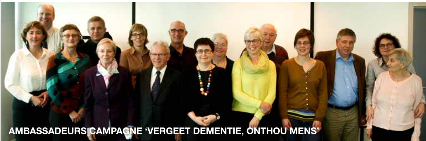
AMBASSADEURS CAMPAGNE 'VERGEET DEMENTIE, ONTHOU MENS'