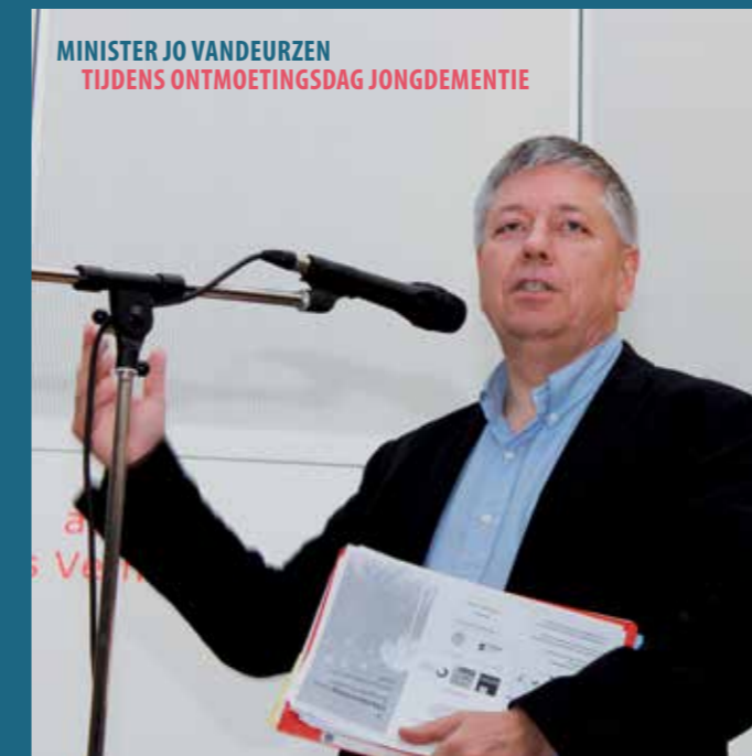
MINISTER JO VANDEURZEN TIJDENS ONTMOETINGS DAG JONGEMENTIE

Onder de Hoge Bescherming van Hare Majesteit de Koningin