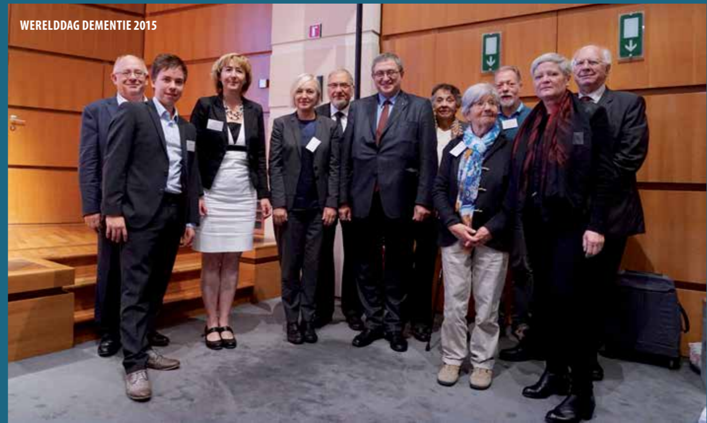
WERELDDAG DEMENTIE 2015

Onder de Hoge Bescherming van Hare Majesteit de Koningin