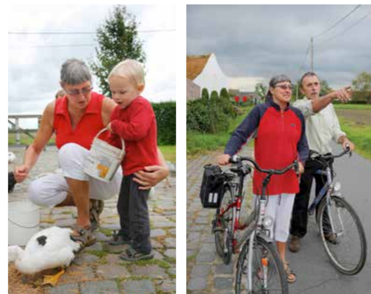
Bron: Website "Vergeet dementie, onthou mens" www.onthoumens.be

Dat is veel meer dan het oppervlakkige geknoei dat je ziet. Een vat boordevol gevoel, moeilijk om te uiten. Aan het gevoel dat je krijgt van haar, bij het verdienen van haar vertrouwen, merk je dat ze meer voelt dan iedereen denkt. Ze is niet dood, nog lang niet. Ze is niet wat de maatschappij van haar denkt. Ook zij verdient een waardig leven waarin ze belangrijk is. Ook zij heeft haar eigen wil en gevoel. Laat haar leven zoals zij dat wil en omgaan met mensen zoals alleen zij dat kan.