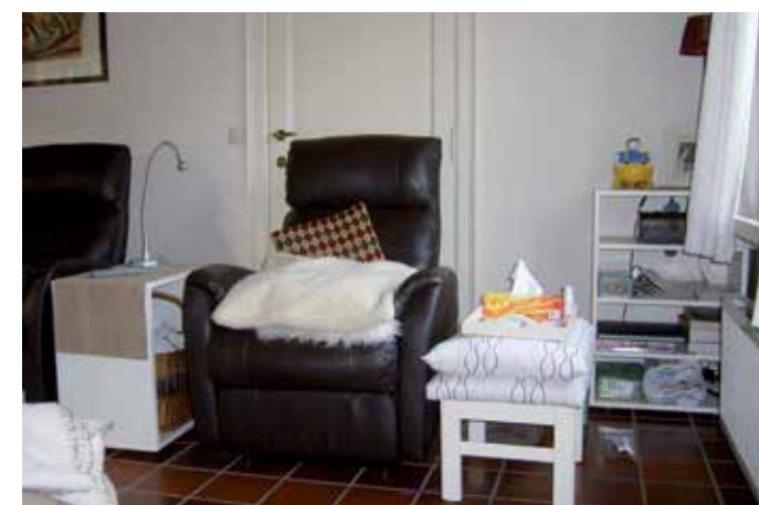
Figuur 1: Deze zetel in de living biedt een dame met dementie een strategische plek. Ze heeft er spulletjes bij de hand om er op een comfortabele manier te vertoeven. Vanuit haar zetel staat ze in contact met andere mensen in huis en met de buurt.

De leefwereld van mensen met dementie is vol onzekerheden en wordt onbegrijpbaar. Daarom is het belangrijk plekken in te richten waar ze langere tijd op een comfortabele manier kunnen vertoeven en geborgenheid kunnen vinden. Bijvoorbeeld, een plek waar ze contact hebben met een vertrouwenspersoon (zoals een mantelzorg), waar ze naar buiten kunnen kijken, of juist een plek waar ze tot rust kunnen komen door zich terug te trekken.