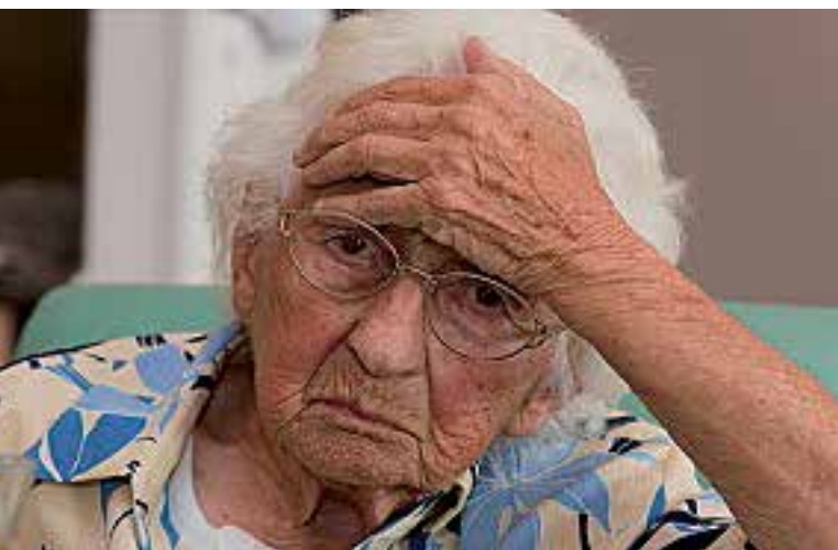
Pijn bij dementie is een vaak voorkomend doch onderschat probleem.