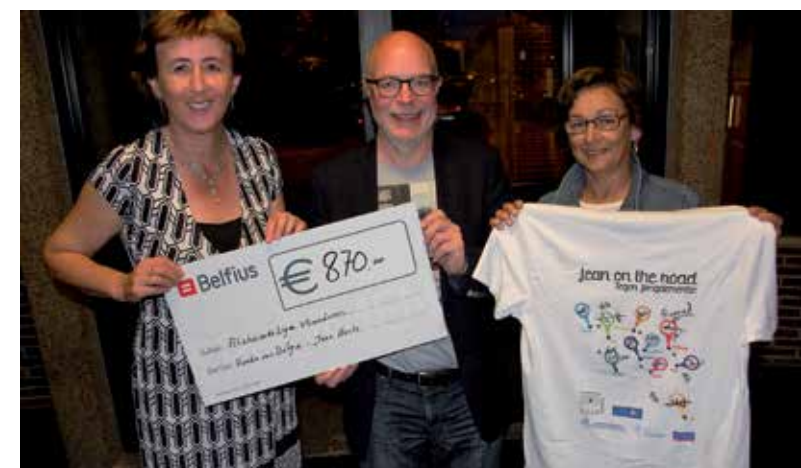
Goednieuwskrant Z, 20/09/2016, p. 34.